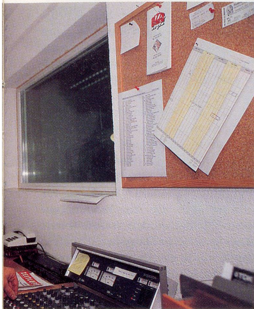
Thomas Meuli im Kontrollraum des