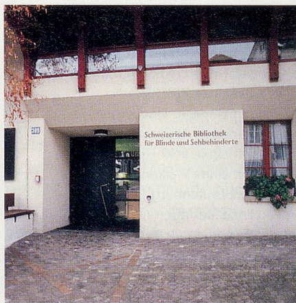
Albisriederstrasse 399, der SBS-Hauptsitz vis-à-vis des Tonstudios, Hausnummer 400

V iele Schauspieler, Fernseh- oder Radiosprecher kennen die Adresse und kommen gerne zur Arbeit in das Haus an der Albisriederstrasse 400 in Zürich. Nicht, dass sie