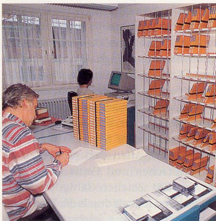
Hier kommen die Kassetten in den Versand ...