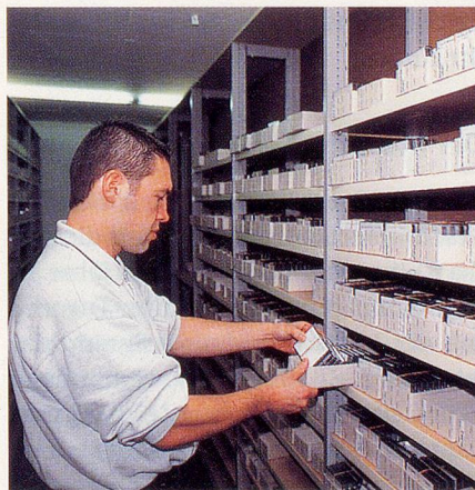
... und hier ins Archiv

peditive Belieferung mit sämtlichen Abo-Ausgaben möglich ist, ist das Studio nach dem Abhören auf eine rasche Rücksendung der Kassetten in der Versandbox jedoch angewiesen. Deshalb kann etwa die aktuellste Ausgabe der Zeitlupe nur dann zugestellt werden, nachdem die vorherige retourniert wurde. Es besteht allerdings die Möglichkeit, auch ältere Ausgaben nach Bedarf nochmals anzufordern, da Kopien vorhergegangener Nummern eine gewisse Zeit im SBS-Archiv aufbewahrt werden.