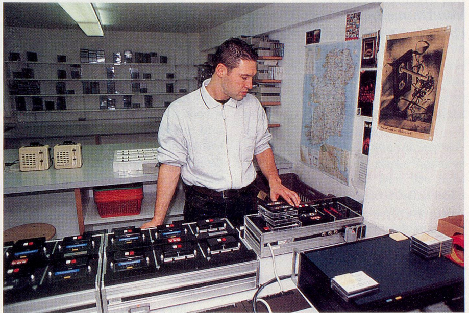
... und am Kopiertisch, wo die Vervielfältigung für den Versand stattfindet.