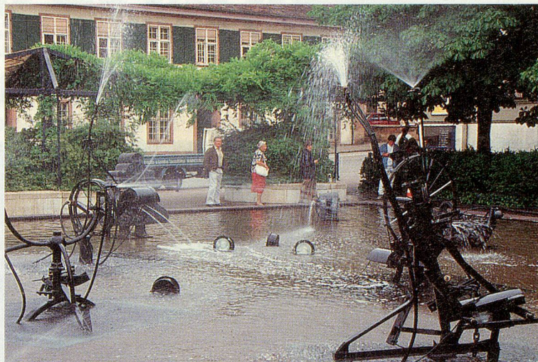
Der Tinguely-Brunnen auf dem Theaterplatz.

schlossen wurden und das Schweizerische Sportmuseum an der Missionsstrasse ums Überleben kämpft, sind neue Museen aufgegangen. Die berühmte Kunstsammlung der Fondation Beyeler befindet sich in der zum Kanton Basel-Stadt gehörenden Landgemeinde Riehen, während das Tinguely-Museum von Mario Botta direkt zwischen Autobahnbrückenkopf und den Chemiewerken von Roche im Kleinbasel steht. Die verrückten Maschinen des Fribourger Jean Tinguely, der zu Lebzeiten Basel stets als seine Wahlheimat bezeichnete und an der Fasnacht selbst in einer Clique immer dabei war, sind jedoch auch anderorts in der Stadt allgegenwärtig. Bereits in der SBB-Bahnhofshalle werden Besucherinnen und Besucher von der Tinguely-Riesenskulptur «Luminator» begrüsst, und auf dem Theaterplatz gehört der Tinguely Brunnen längst zu einem vielbesuchten Wahrzeichen der Stadt. Nur wenige Schritte vom Brunnen entfernt, beim Barfüsserplatz, öff-