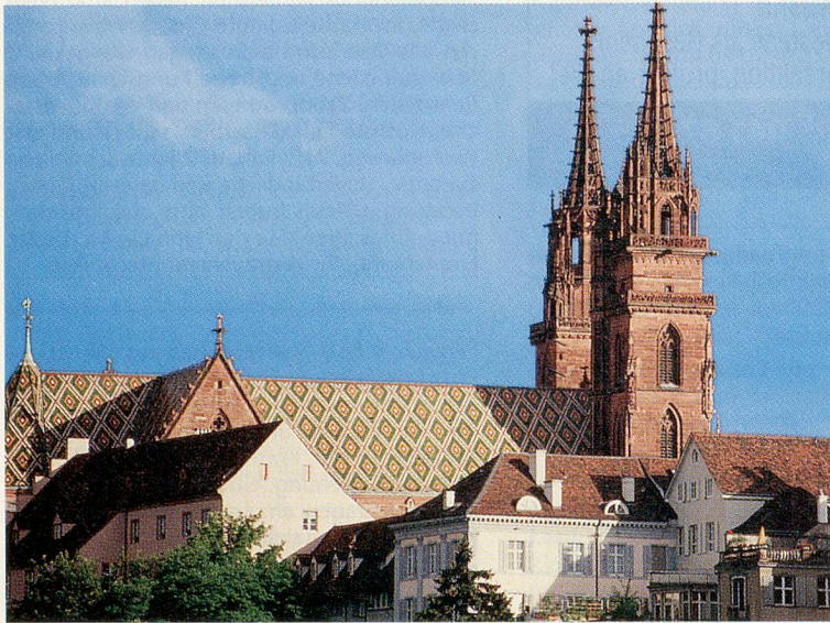
Das Basler Münster im Abendlicht.