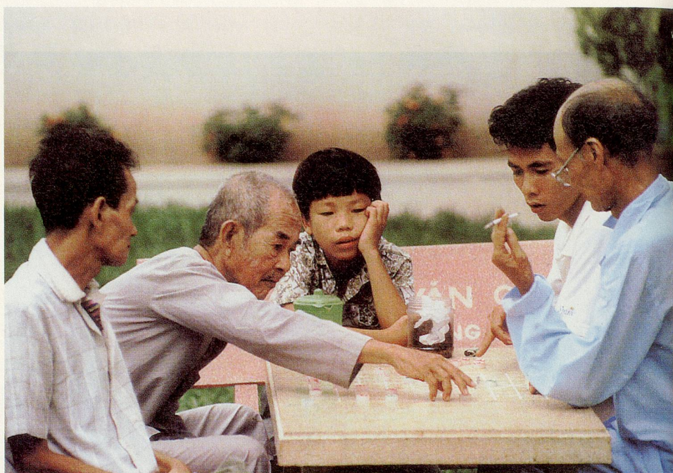
Miteinander unter einem Dach leben, heisst auch miteinander spielen.

D ie Fahrt von der pulsierenden ehemaligen Hauptstadt des Südens, Saigon, nach Chau Doc dauert fast sechs Stunden. Die obligate Reifenpanne nicht eingerechnet ... Wir starten bereits um 5 Uhr früh – auch für vietnamesische Verhältnisse «assez tôt»: Auf den schlecht beleuchteten Strassen ist es noch dunkel. Zügig und doch vorsichtig kämpft sich unser Fahrer durch das Heer frühmorgendlicher Fussgänger, Velos und Rikschas. Vor allem sind es aber die Kleinmotorräder, die laut hupend nach Verkehrsregeln, die wir auch nach 14-tägigem aufmerksamen Studium noch nicht begriffen haben, durch die dämmrigen Strassen preschen.