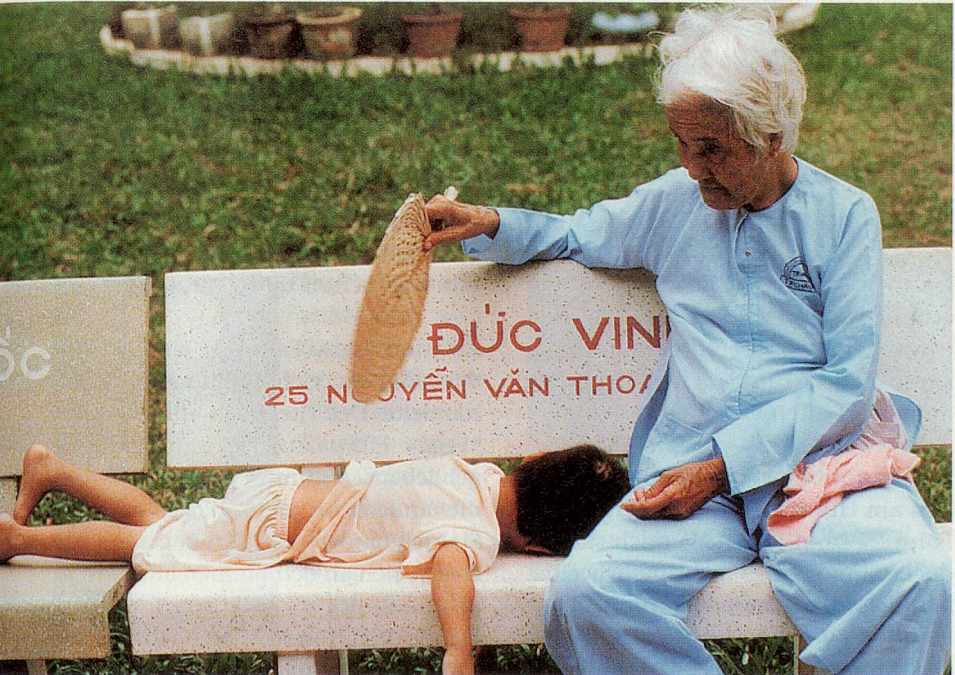
Eine Grossmutter und ein Enkelkind finden sich.

In der vietnamesischen Gesellschaft ist der Familiensinn noch stark ausgeprägt. Man lebt auf kleinem Raum zusammen und ist es gewohnt, Haus, Garten und Essen zu teilen. Allein sein wird hier als besonders hart empfunden.