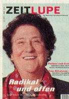
Titelbild Emilie Lieberherr, alt Ständerätin