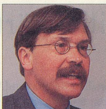
MARTIN MEZGER DIREKTOR PRO SENECTUTE SCHWEIZ

Niemand kommt ohne den täglichen prüfenden Blick in den Spiegel aus – auch wenn dieser, grosso modo, stets dasselbe zeigt. Und wohl auch das Gleiche auslöst: je nach persönlicher Veranlagung eine mittlere Zufriedenheit oder eine mittlere Unzufriedenheit. Von Zeit zu Zeit aber ergibt der Blick in den Spiegel ein anderes Resultat: etwas