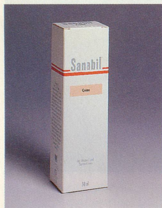
Unterstützt die natürliche Regeneration der Haut.

Jede Haut altert. Manche schneller, manche langsamer. Der Alterungsprozess hängt davon ab, wie gut sich die Haut regenerieren kann und wie stark ihre Widerstandskraft gegen schädigende Einflüsse ist. Der natürliche Alterungsprozess, bedingt durch eine verlangsamte Zellteilung, kann durch den Einsatz von geeigneten aktiven Stoffen hinausgezög-