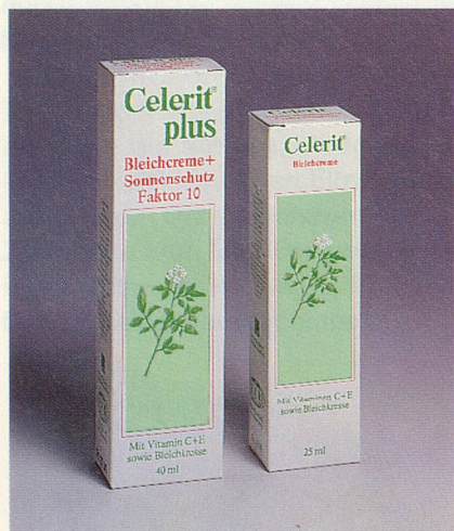
Schutz vor Pigmentflecken

Ihr gepflegtes und attraktives Aussehen ist Ihnen wichtig. Wären da nur nicht diese ärgerlichen Flecken auf Ihrer Haut. Grund genug, jetzt etwas gegen Pigmentflecken zu tun. Fragen Sie deshalb nach Celerit. Diese