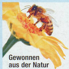
Gewonnen aus der Natur

Nach dem Schlüpfen produzieren Bienen nur kurze Zeit aus ihren Kopfdrüsen Weisefuttersaft – auch Gelée Royale genannt. Dieses spezielle Futter ist ausschliesslich nur für die Bienenkönigin allein bestimmt. Durch dieses Energie-Futter wird sie deshalb 5mal so alt und doppelt so gross wie die normalen Bienen und hat so die Kraft um täglich bis zu 2000 Eier zu legen.