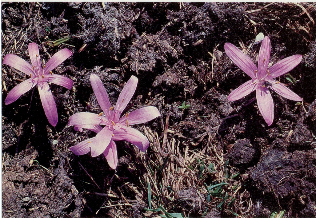
Alljährlich vom Februar bis Ende April erblühen auf den Wiesen und Weiden von Eischoll die seltenen Lichtblumen.

Kaum ist der Schnee geschmolzen, blühen an den Hängen von Eischoll hunderte von Lichtblumen auf. Diese lilafarbenen Frühlingsblüher sind in der Schweiz nur an einigen Hängen im Wallis zu finden. Aber die Hangwanderung von Eischoll bis nach Gampel hat botanisch noch mehr zu bieten.