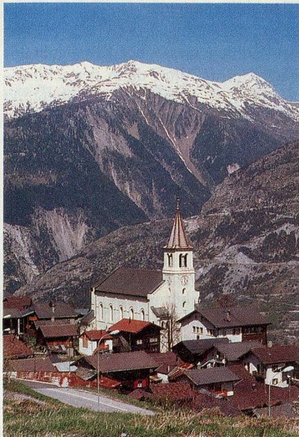
Das Walliser Bergdorf Eischoll. Auf seinem Gemeindegebiet wurde der letzte Wolf in der Schweiz erlegt.