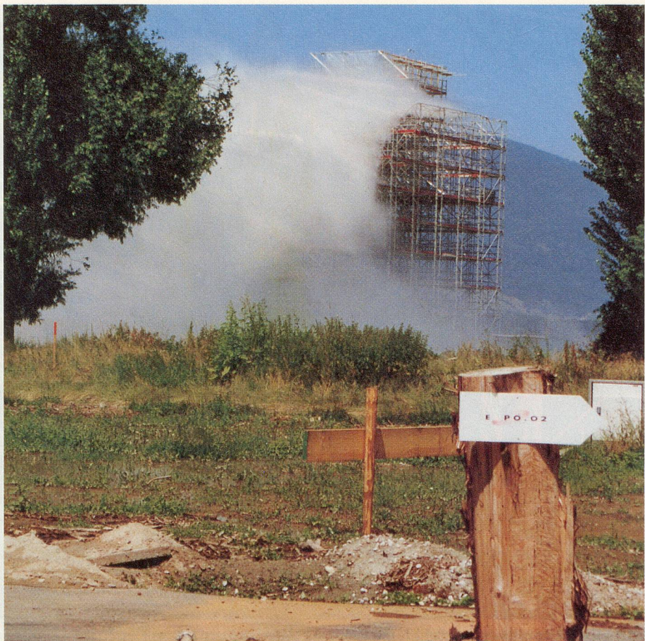
Noch wird experimentiert mit der künstlichen Wolke über der Arteplage Yverdon.

Jede veröffentlichte Antwort wird mit 20 Franken belohnt. Einsendeschluss ist der 8. Oktober 2001.