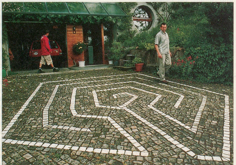
Labyrinth Rütli: aus «Bsetzistei» auf der Garageinfahrt eines Privathauses.

Die meisten Labyrinth in der Schweiz werden heutzutage von Institutionen und Freiwilligen vorwiegend auf öffentlich zugänglichem Grund gebaut: als Oase der Ruhe, als Raum für Veranstaltungen und zur Selbstbesinnung oder als Garten, der von der Gemeinschaft gepflegt wird. Um das älteste öffentliche