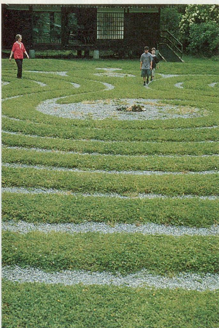
Labyrinth Boldern: Oase im Garten.