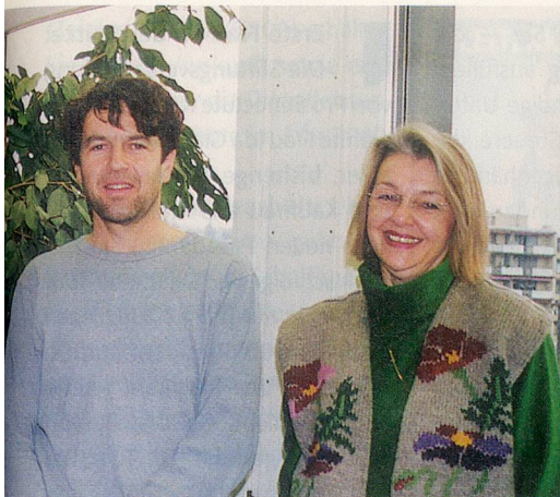
ffigen Kanton wird zusammengearbeitet.