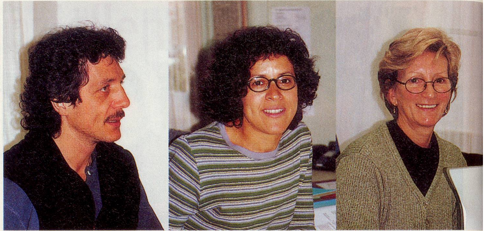
Vom Sozialarbeiter (links) bis zum Buchhalter (rechts): Das gut eingespielte Team von