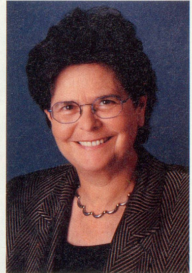
Bundesrätin Ruth Dreifuss

Seit 85 Jahren wird Pro Senectute zu einem bedeutenden Teil von der Bevölkerung mitgetragen. Ich bitte Sie deshalb: Unterstützen Sie Pro Senectute im Rahmen der laufenden Sammelaktion – und auch sonst. Für Ihren Beitrag danke ich Ihnen herzlich!