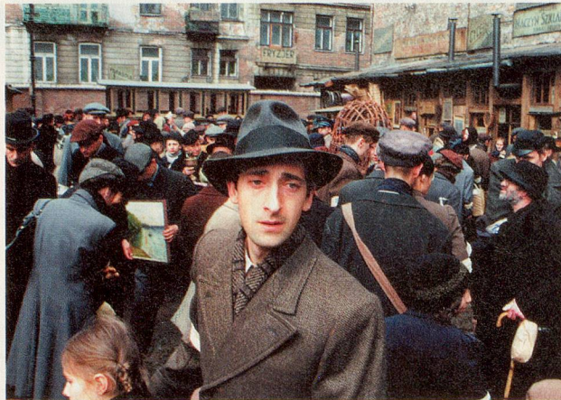
Wladyslaw Szpilman (Adrien Brody) kämpft ums Überleben.

Die Autobiografie «Das wunderbare Überleben» des polnischen Pianisten Wladyslaw Szpilman liegt dem Film zugrunde: Schon bald muss die Familie Szpilman einsehen, dass es ein Fehler war, in Warschau zu bleiben. Denn die Nazis treibt sie mit allen anderen Juden in ein Getto. Wladyslaw Szpilman (grossartig dargestellt von Adrien Brody) findet Arbeit als Pianist in einem Restaurant, in welchem wohlhabende Juden verkehren. Sein Bruder findet dies verwerflich, sterben doch täglich arme Juden den Hungertod. Schliesslich wird auch das Restaurant, diese letzte Erinnerung an ein zivilisiertes Leben, zerstört. Szpilmans Familie wird deportiert. Ein alter Freund, der bei der jüdischen Gettopolizei arbeitet, kann Wladyslaw retten. Für den Musiker folgt eine lange Zeit des Wartens. Ohne jegli-