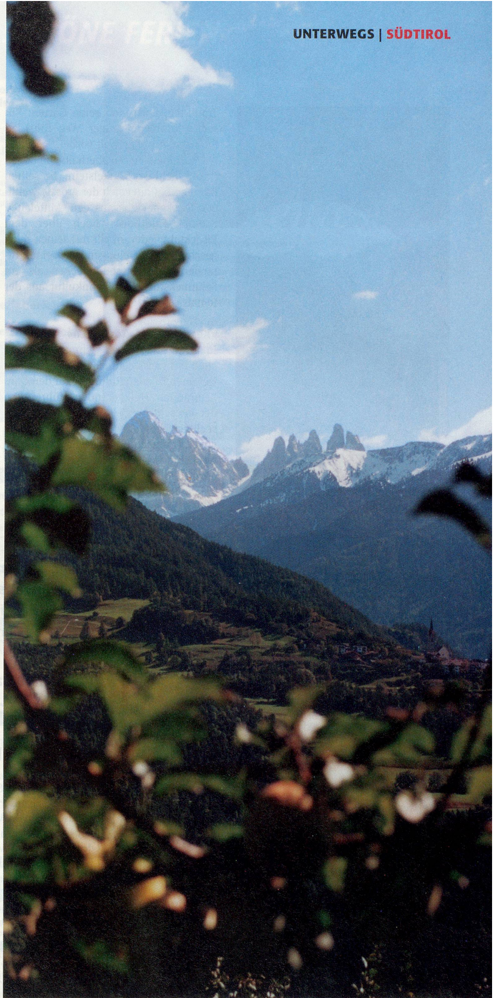
Der Blick vom «Keschtnweg» auf die bizarr geformten Gipfel der Dolomiten.

Hoch über den Tälern prägen 400 geschichtsträchtige Burgen und Schlösser das Landschaftsbild. Auf Schloss Juval in der Region Vinschgau residiert Reinhold Messner. Einige Räume sind auch für die Öffentlichkeit zugänglich. Auf Schloss Sigmundskron in der Nähe von Bozen realisiert der Extrembergsteiger zurzeit ein Bergmuseums-Projekt. Auf Schloss Trauttmansdorff in Meran verbrachte Kaiserin Sissi den Winter 1870/71. Gäste können dort auf ihren Spuren wandeln. Eine besondere Attraktion von Schloss