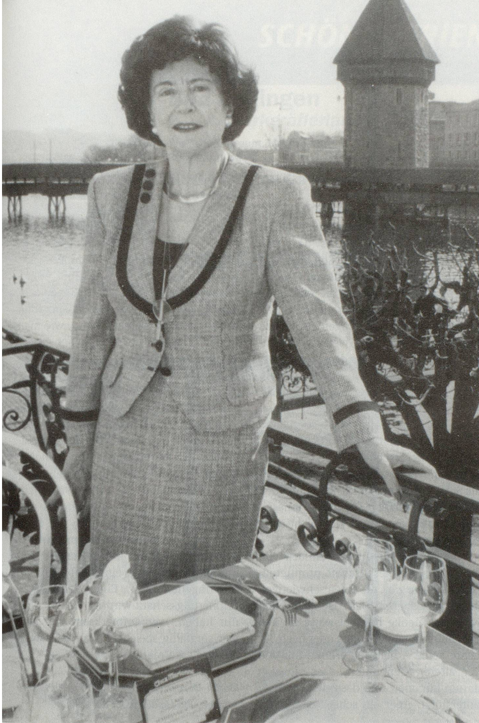
BILDER: ZVG; VERENA INGOLD