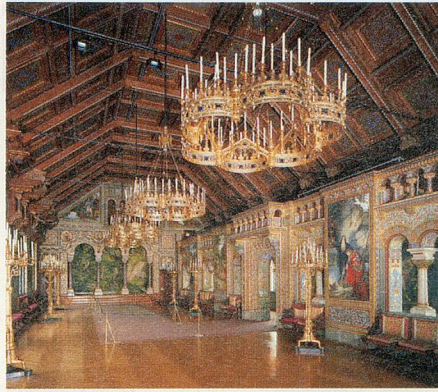
Der Sängersaal: Ludwig II. liess den Fest- und Sängersaal der Wartburg kopieren.

Nicht nur von aussen sieht Neuschwanstein mit seinen Türmen, Zinnen und Bogenfenstern aus wie ein Märchen-