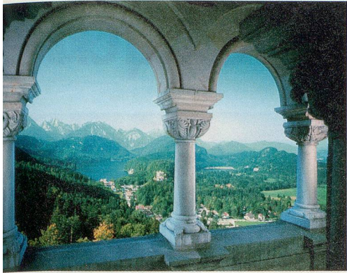
Der Balkon: Der Ausblick auf Bayerns Hügel und Seen und auf die Tiroler Alpen.

Schloss Neuschwanstein wurde der Öffentlichkeit übergeben. Bereits im ersten Jahr zählte man 17000 Besucherinnen und Besucher, heute sind es jährlich rund 1,3 Millionen. In der Hochsaison werden täglich bis zu zehntausend Touristinnen und Touristen durch die königlichen Gemächer geschleust.