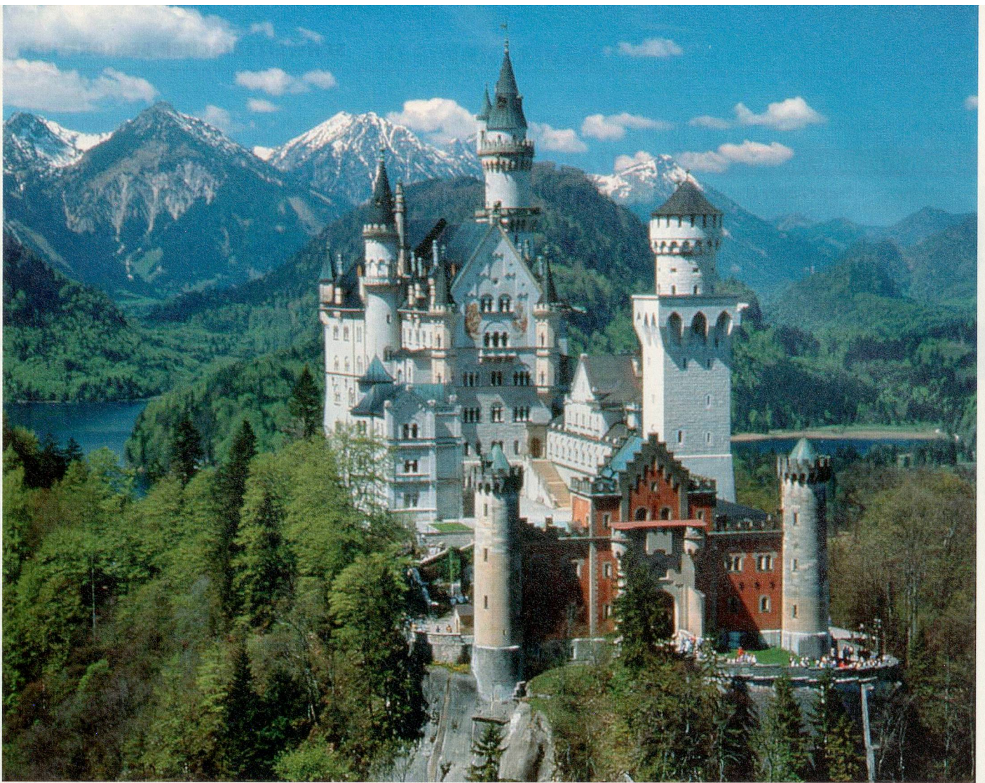
Ein Labyrinth von Zinnen und Türmen: Schloss Neuschwanstein, der reale Traum des Königs Ludwig II. von Bayern.