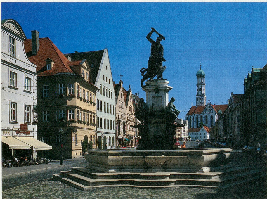
In der Stadt der schwerreichen Fugger: Die Maximilianstrasse in Augsburg.

Begleiten Sie uns Anfang Oktober 2004 nach Regensburg, Augsburg und München. Tauchen Sie in vergangene Welten ein, wandeln Sie auf den Spuren des Märchenkönigs Ludwig II. in den Schlössern Neuschwanstein und Hohenschwangau. Reisen Sie unter Führung des Reiseanbieters BTI Kuoni Event Solutions und in Begleitung von Mitarbeitenden der Zeitlupe nach Bayern. Wir versprechen Ihnen unvergessliche Tage!