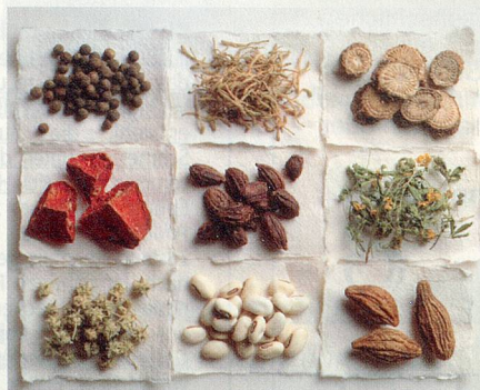
Die Apotheke der Natur: die Grundstoffe für tibetische Medikamente.

Besonders bewährt haben sich tibetische Arzneimittel bei den im Westen verbreiteten Altersbeschwerden wie Arteriosklerose und Durchblutungsstörungen sowie Magen-Darm-Problemen. So wird