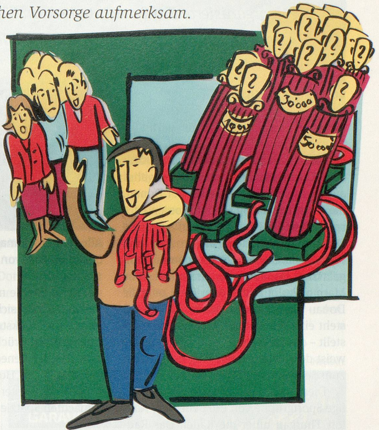
ILLUSTRATION: BARBARA BIENHOLZ

zwanzig Fällen hat er vergessene Guthaben von über einer Million Franken entdeckt. Das beglückt nicht nur die betroffenen Pensionäre. Auch der Staat, und damit die Steuerzahler, stehen in Kaltenrieders Schuld, wenn Zusatzleistungen der AHV oder Fürsorgegelder zurückerstattet oder nicht beansprucht werden.