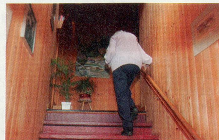
Ohne Hilfe unterwegs: Gebückt, aber züchtig meistert die 107-Jährige die Treppe.

Seit einigen Jahren sammelt sie alle Zeitungsberichte über 100-Jährige im In- und Ausland. «Das sind meine Vorbilder. Für uns Alte ist es schön, noch andere gleichaltrige Frauen und Männer am Leben zu wissen.» Irgendwie verspürt sie eine Sehnsucht, die einen oder andern der über 100-Jährigen einmal zu treffen. Ob das wohl ginge, fragt sie leise. ■