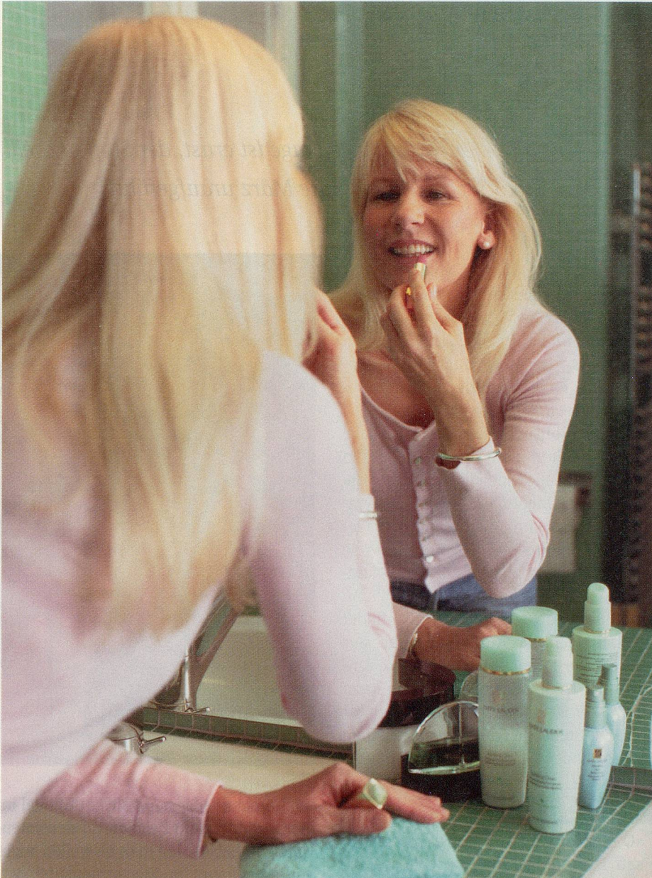
Cremen, schminken, salben: Kosmetika helfen die reife Haut pflegen.

Bundesamt für Gesundheit BAG erlaubter Nahrungsmittelzusatz, der auch in Reha-Kliniken verwendet wird. Besonders Senioren empfiehlt Wallimann, die Hälfte des Tagesbedarfs in Pulverform einzunehmen. Einen Teil gibt es im Essen, vor allem in frischem Fisch, Poulet, Rindfleisch und in luftgetrocknetem Fleisch. Doch der Experte warnt vor Kreatinbestellungen per Internet, das Risiko bestehe, dass verunreinigte oder gar hormonversetzte Präparate angeboten würden (siehe Tipps auf Seite 9).