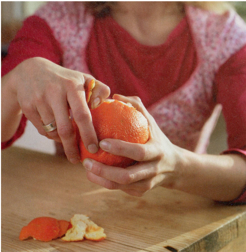
Hilfreiche Früchtchen: Zitrusfrüchte sind wertvolle Vitamin- und Kalziumlieferanten.