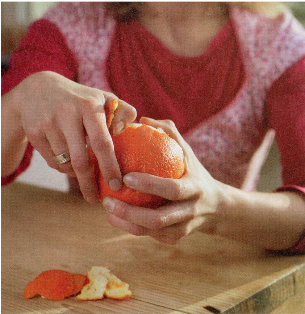
Hilfreiche Früchtchen: Zitrusfrüchte sind wertvolle Vitamin- und Kalziumlieferanten.