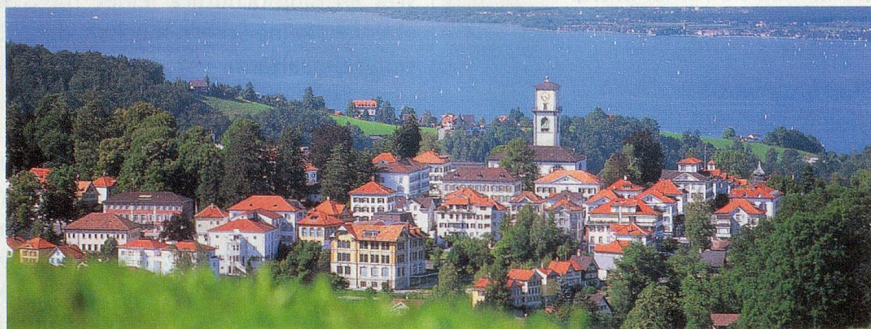
Biedermeier-Dorf Heiden hoch über dem Bodensee