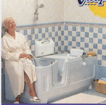
Lift paßt auch auf Ihre vorhandene Badewanne

VitaActiva, der Spezialist für sicheres, unbeschwertes Badevergnügen