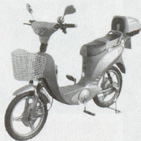
Diverse Modelle ab Fr. 690.--