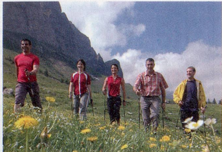
Gesundheit und Spass mit Nordic Walking

Die hügelige, prachtvolle Ferienregion über dem Bodensee lädt zum Verweilen ein. Hier verbirgt sich eine der schönsten und noch unberührtesten Regionen zum Ausspannen. Sie ist einzigartig für Wanderfreunde, Sonnengeniesser und Gesundheitsbewusste. Zudem versetzt das unverfälschte, vielfältige und einzigartige Brauchtum Gross und Klein in Staunen. Ein Ja zu Wohlbefinden und Genuss – ein Ja zum Appenzellerland.