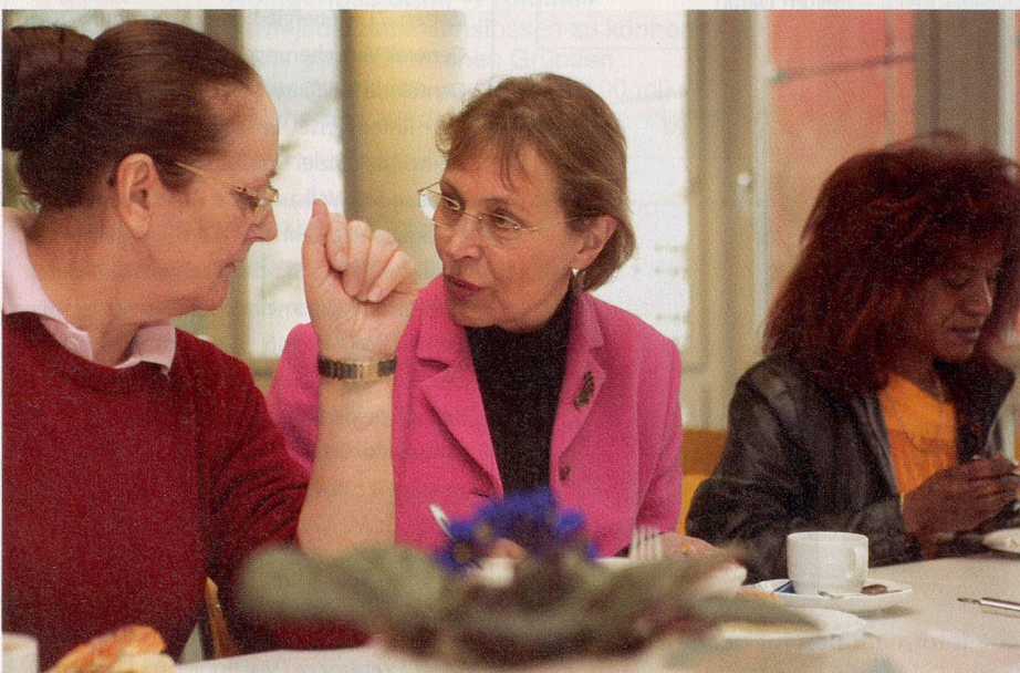
Miteinander sprechen: «Kontakt-Tandem interkulturell» bringt Kulturen zusammen.