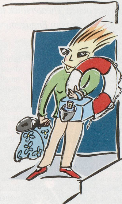
ILLUSTRATION: BARBARA BIETENHOLZ

ein einzelnes Arrangement bezogenen Abschluss.