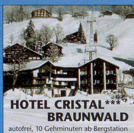
HOTEL CRISTAL *** BRAUNWALD autofrei, 10 Gehminuten ab Bergstation

vch HOTELS Verband Christlicher Hotels www.vch.ch