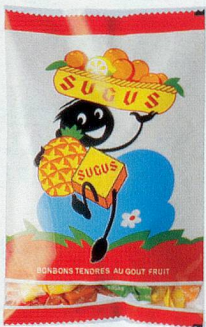
Sugus, 400 g, 5.45

Zum Jubiläum von Pro Senectute finden Sie bei Coop vom 4. bis 15. September 2007 ausgewählte Angebote im Nostalgiedesign, von denen 10% des Verkaufspreises an Pro Senectute gehen.