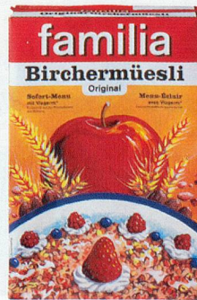
Familia Müesli, ungezuckert, 375 g, 2.60