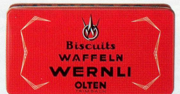
Wernli Jura Waffeln, inkl. Nostalgiedose, 3 x 250 g, 8.95