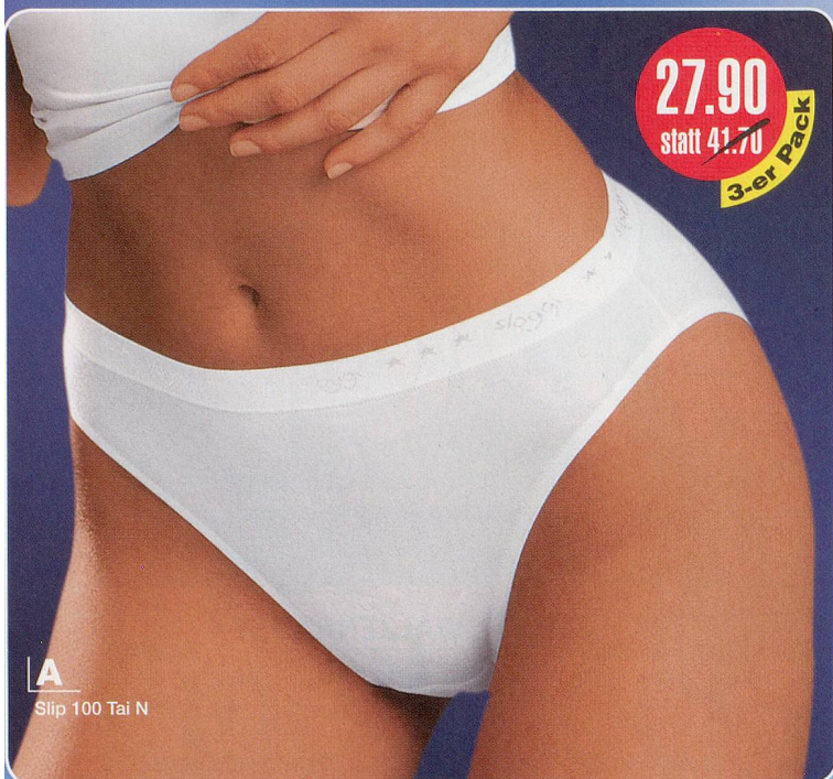
A Slip 100 Tai N

A Sloggi 100 Tai N 95% Baumwolle, 5% Lycra Maschinenwäsche 75-596.171 weiss Grössen: 36-46 3-er Pack Fr. 27.90 statt 41.70