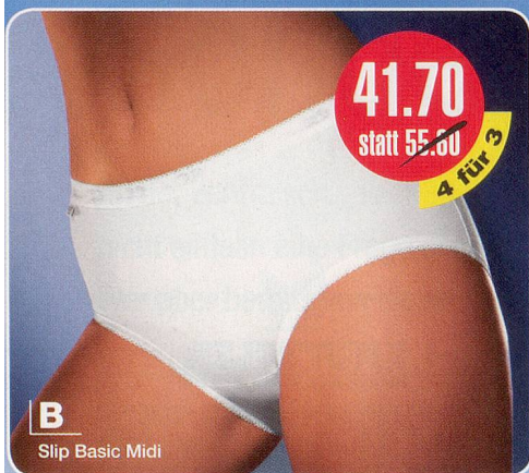
B Slip Basic Midi

D Sloggi Control Maxi 94% Baumwolle, 6% Lycra Maschinenwäsche 75-596.213 weiss 75-596.221 schwarz Grössen: 38-54 4 für 3 Fr. 59.70 statt 79.60