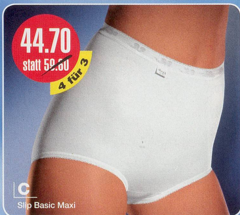
C Slip Basic Maxi