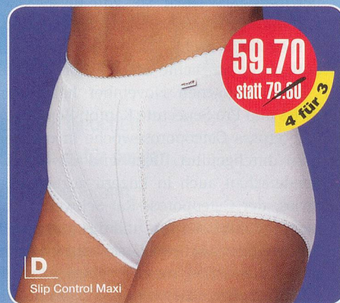
D Slip Control Maxi