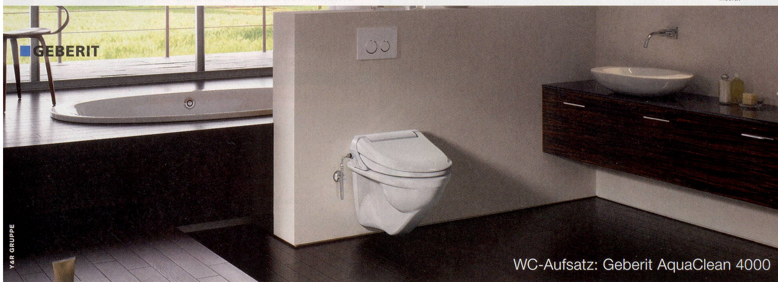
WC-Aufsatz: Geberit AquaClean 4000