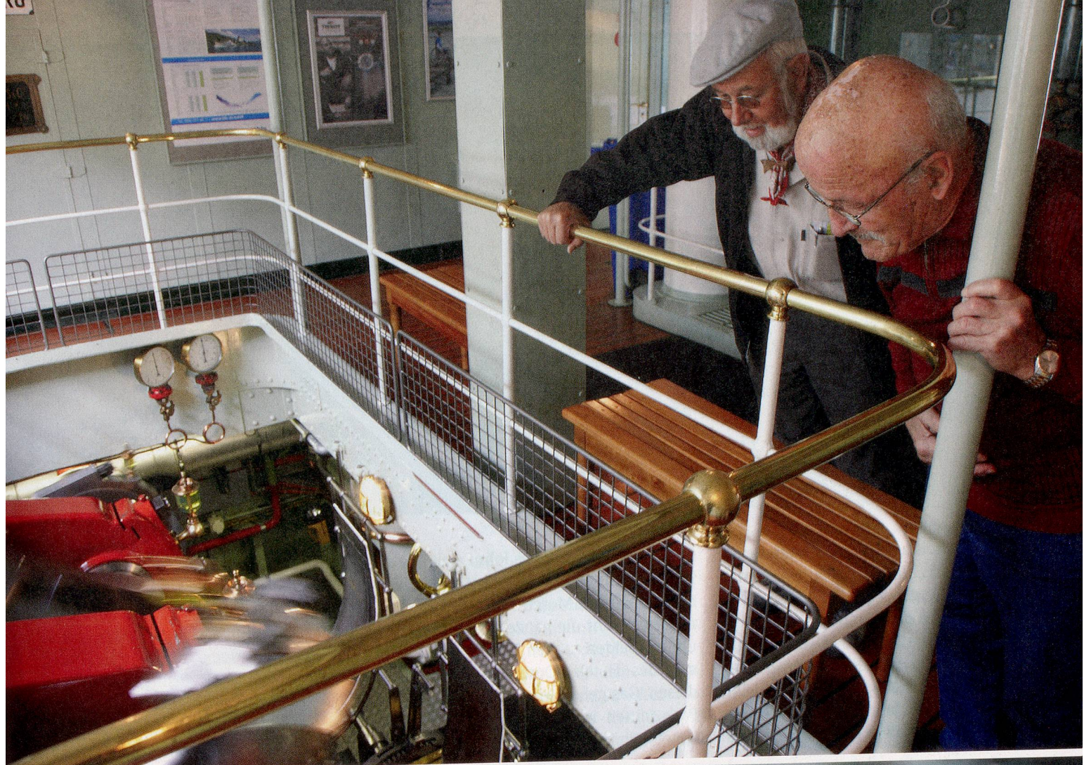
Der Ausflug auf den Brienersee und die grosse Faszination der Dampfmaschinen entlasten und animieren alle Beteiligten.