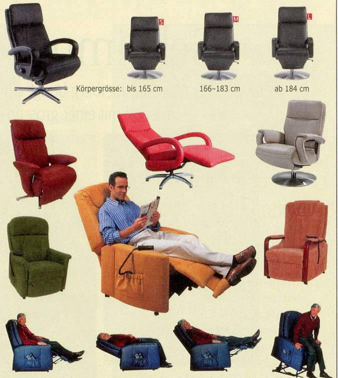
Körpergrösse: bis 165 cm