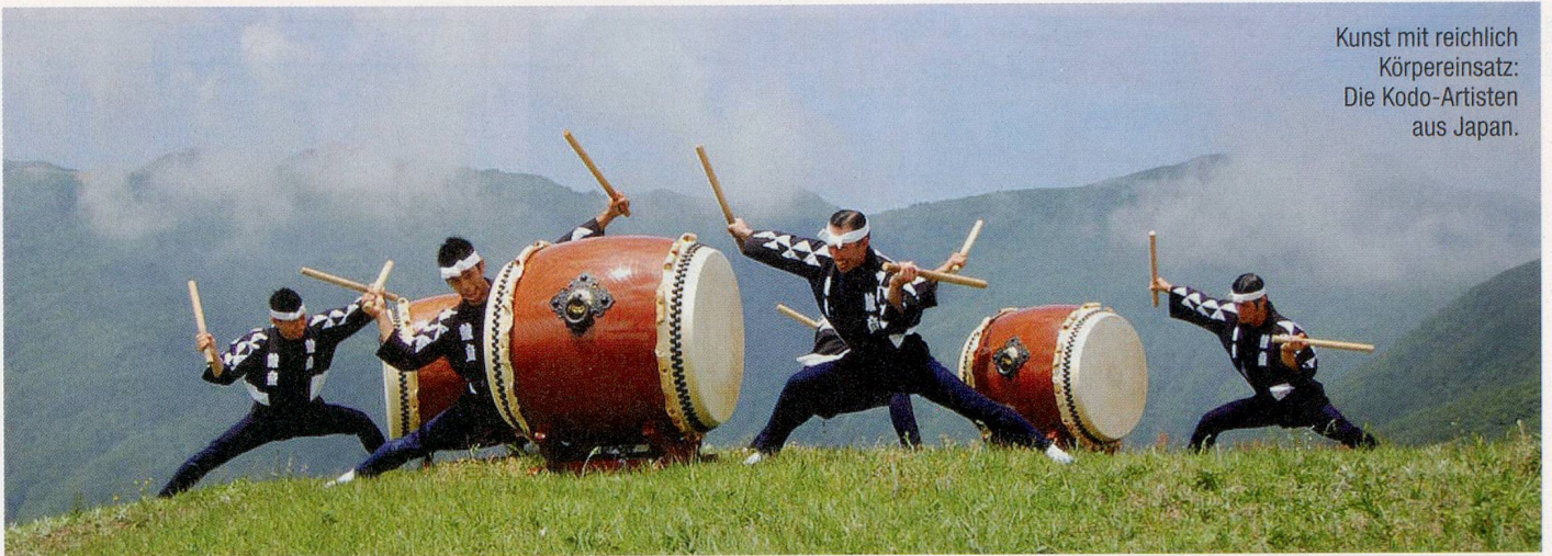
Kunst mit reichlich Körpereinsatz: Die Kodo-Artisten aus Japan.