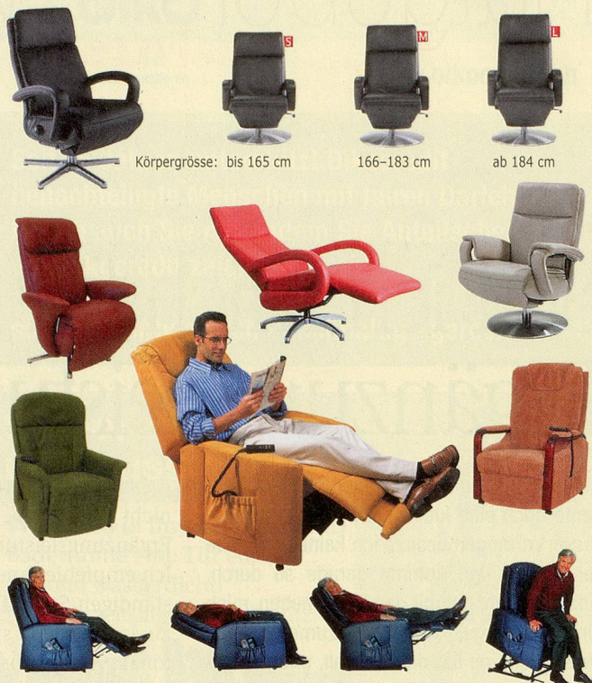
Körpergrösse: bis 165 cm 166–183 cm ab 184 cm

• Grosse Auswahl • Eigener Showroom • Heimservice ganze Schweiz Mehr unter www.rentschsitzgut.ch oder Prospekt anfordern