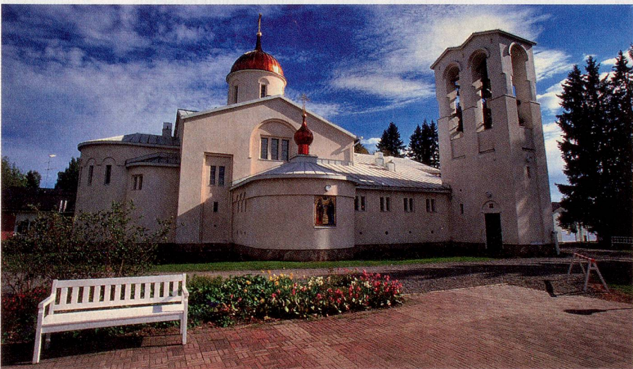
Das orthodoxe Kloster Valamo erinnert an Finnlands Nachbarschaft zu Russland.

Koli aus – wie vom Bomba-Haus, einem historischen, rekonstruierten karelischen Gutshof am See mit Restaurant, Hotel und Wellnessanlage – hat man darauf eine fantastische Aussicht. Savonlinna in der Seenplatte lockt als schöne Stadt und mit den weltbekannten Freiluft-Opernspielen in einer Burg, die genauso auf