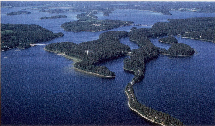
Vor allem Wald und Wasser: Finnlands Seenplatte ist eine Komposition in Blau und Grün.