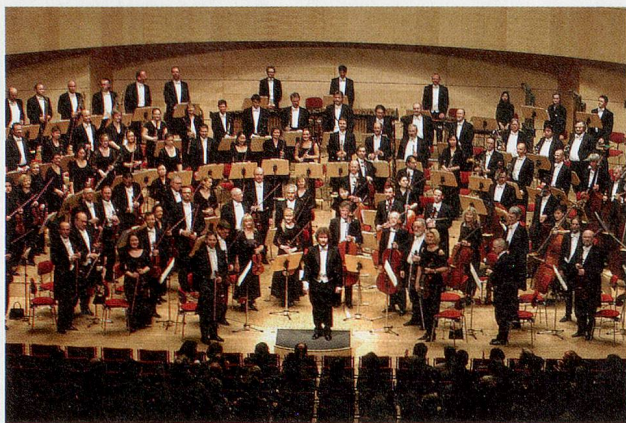
Die Neue Philharmonie Westfalen nimmt Sie mit auf eine klingende Reise nach Tschechien und Polen.