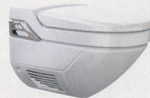
Geberit AquaClean 8000 plus

Das Multitalent für Topkomfort bietet viele Zusatzfunktionen und individuelle Einstellmöglichkeiten. Ideal für Mietwohnungen.