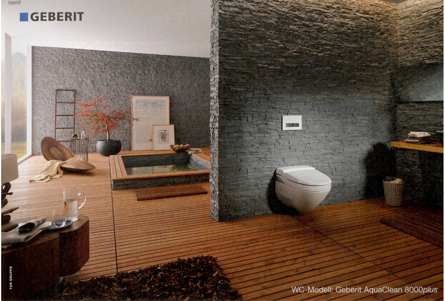
WC-Modell: Geberit AquaClean 8000 plus