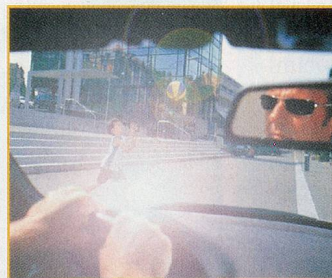
Ohne polarisierende Sonnenbrille