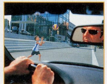
Blendfreie Sicht mit polarisierender Sonnenbrille