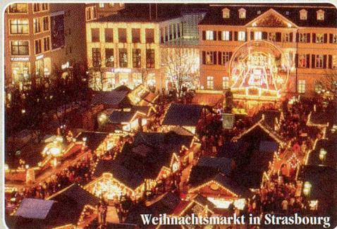
Weihnachtsmarkt in Strasbourg