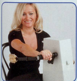
Nur Arme bewegen