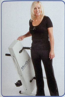
Einfach und leicht zu transportieren

Hält Sie aktiv, fit und beweglich bis ins hohe Alter Schont Gelenke und Knochen – ohne Sturzgefahr Seit 20 Jahren erprobt von Senioren und Reha Kunden