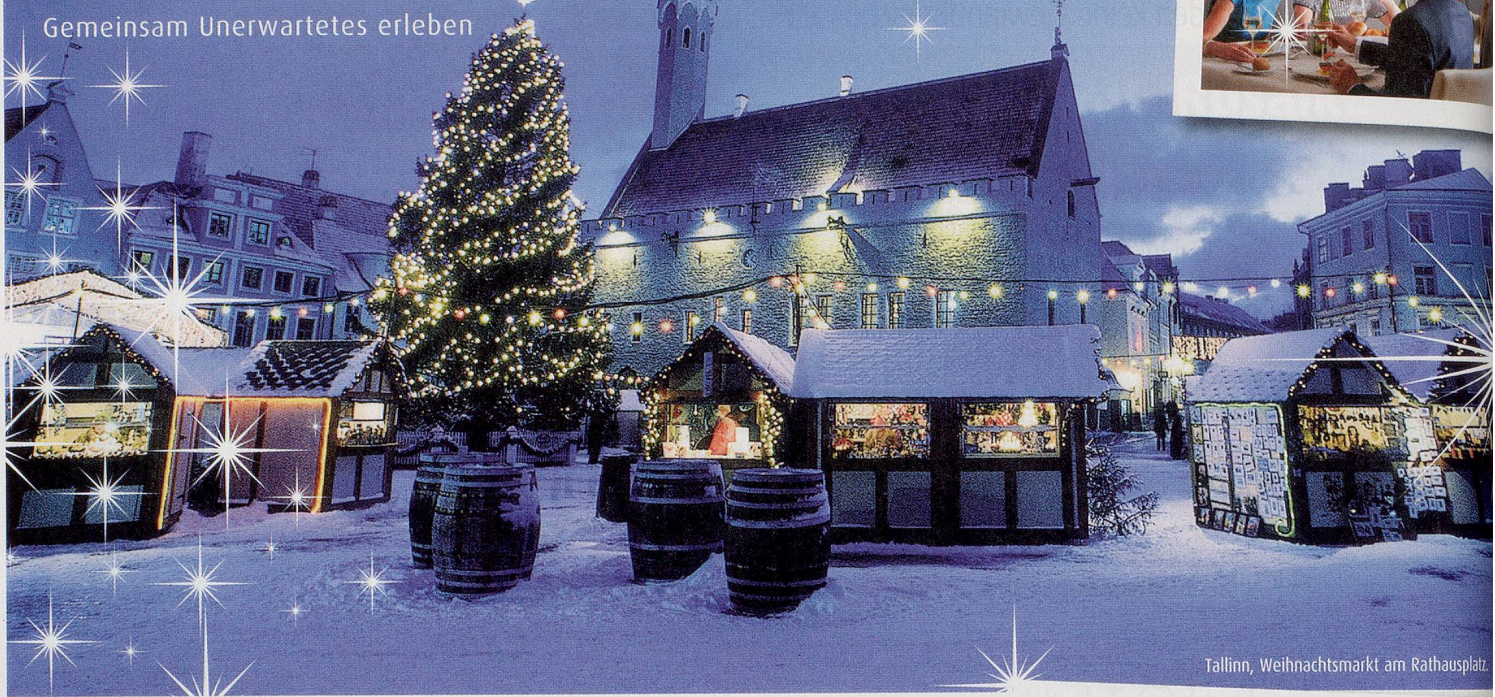
Tallinn, Weihnachtsmarkt am Rathausplatz.

Auf unseren City Explorer Reisen werden Sie zum echten Insider und erleben die Vergangenheit, Gegenwart und Zukunft einer Stadt hautnah. Genügend freie Momente und fakultative Ausflüge lassen Zeit für eigene Entdeckungen. Erleben Sie «Ihre» Traumstadt über die Festtage unter kundiger Führung und mit Gleichgesinnten!