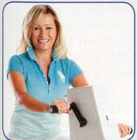
Nur Arme bewegen