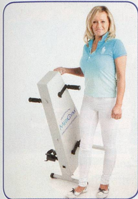
Einfach und leicht zu transportieren

Hält Sie aktiv, fit und beweglich bis ins hohe Alter Schont Gelenke und Knochen – ohne Sturzgefahr Seit 20 Jahren erprobt von Senioren und Reha Kunden