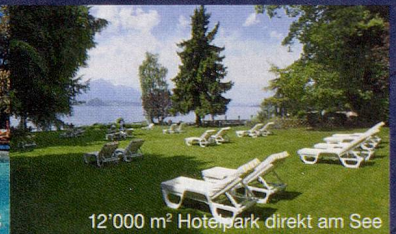
12'000 m² Hotelpark direkt am See