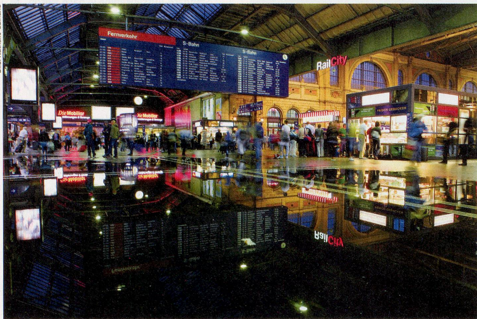
Bei einem ungewöhnlich heftigen Sommergewitter wird der Bahnhofboden gar zu einem Spiegel.