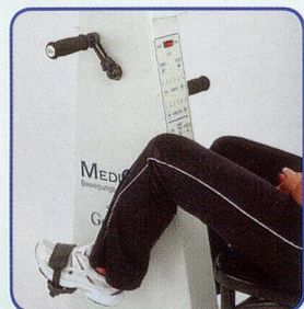
Nur Beine bewegen