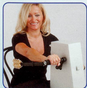
Nur Arme bewegen