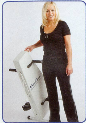
Einfach und leicht zu transportieren

Hält Sie aktiv, fit und beweglich bis ins hohe Alter Schont Gelenke und Knochen – ohne Sturzgefahr Seit 20 Jahren erprobt von Senioren und Reha Kunden