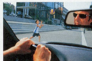
Blendfreie Sicht mit polarisierender Sonnenbrille.