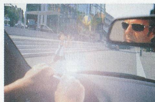
Ohne polarisierende Sonnenbrille.

Elf verschiedene Modelle berücksichtigen unterschiedliche Brillengrössen und individuelle Modewünsche. Dank des moderaten Preises von CHF 59.90 (Kindermodell CHF 39.90) lässt sich auch ein zweiter oder dritter Sonnenschutz als Reserve im Handschuhfach bereithalten, ohne das Budget gross zu belasten. Erhältlich im Optikfachhandel.