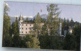
SCHWEIZERHOF FLIMS ROMANTIKHOTEL

Schweizerhof Flims, Romantikhotel – klein, fein, persönlich – ein familiengeführtes Jugendstilhaus in den Bündner Alpen. Geniessen Sie 2 Übernachtungen für 2 Personen im Doppelzimmer, inkl. 5-Gang-Abendmenü. Gültig bis 15. Oktober 2013 und im Sommer inkl. Bergbahnabonnement. www.schweizerhof-flims.ch