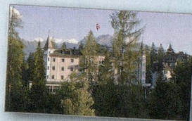
SCHWEIZERHOF FLIMS ROMANTIKHOTEL

Schweizerhof Flims, Romantikhotel – klein, fein, persönlich – ein familiengeführtes Jugendstilhaus in den Bündner Alpen. Geniessen Sie 2 Übernachtungen für 2 Personen im Doppelzimmer, inkl. 5-Gang-Abendmenü. Gültig bis 15. Oktober 2013 und im Sommer inkl. Bergbahnabonnement. www.schweizerhof-flims.ch