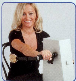
Nur Arme bewegen