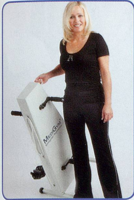
Einfach und leicht zu transportieren

Hält Sie aktiv, fit und beweglich bis ins hohe Alter Schont Gelenke und Knochen – ohne Sturzgefahr Seit 20 Jahren erprobt von Senioren und Reha Kunden